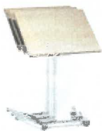
Personal Desk staffelbar