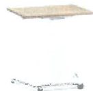
Personal Desk optional mit Höhenverstellung